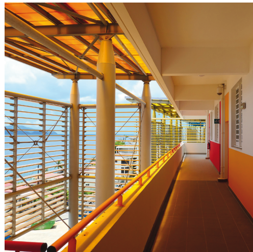
Le premier cycle est accueilli au sein du lycée Schoelcher, de Fort-de-France.